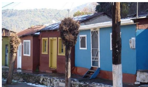
Población Errázuriz de Coya

Esta población, que data del año 1920 aproximadamente, se compone de una serie de viviendas construidas por los propios obreros de la Central Hidroeléctrica, además de trabajadores agrícolas del sector. Se trata de edificaciones no planificadas que se desarrollan en forma lineal adaptándose a la topografía cordillerana. Su materialidad es por lo general madera con relleno de adobillos y revoque de barro. Su arquitectura vernácula se caracteriza por la construcción de zócalos de piedra para habitar la fuerte pendiente precordillerana y la subdivisión predial irregular, generándose distintos ámbitos de apropiación y habitabilidad según la ubicación definitiva de cada vivienda. Destaca el variado colorido de las viviendas, que nace de la necesidad de diferenciación y para resaltar ciertos elementos decorativos de las fachadas, como marcos de puertas y ventanas, almohadillados, pilastras. Los colores que mayoritariamente se repiten son el verde agua, rojo oscuro, ocre, marrón, celeste, azul, amarillo, café, blanco, entre otros. Declarada Monumento Nacional, bajo la categoría de Zona Típica en el año 2012 (Consejo de Monumentos Nacionales).