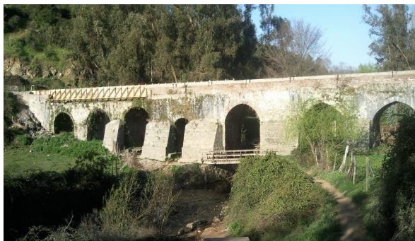
Acueducto Cal y Canto

Fue construido hacia mediados del siglo XIX por un grupo de propietarios del sector para encauzar un canal de regadío. Este canal se conoce como canal Lucano y a través del acueducto, éste cruza la quebrada del estero Machalí. Se llega a caballo o tracking (Servicio Nacional de Turismo, 2012).