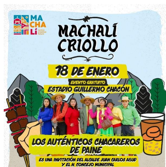
Afiche Fiesta Machalí Criollo

Fiesta costumbrista que cuenta con una muestra artesanal, gastronómica y conjuntos folclóricos. Se desarrolla en la Plaza de Armas (Servicio Nacional de Turismo, 2012).