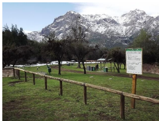
Reserva Nacional Río Los Cipreses

Posee sectores de uso público como: Ranchillo (35 sitios para siete personas cada uno, pozón rústico para baño recreativo y cercanía a senderos inclusivo); Tricahue (tres sitios, el primero para 100 personas y los restantes para grupos de hasta siete personas); y Los Peumos (hasta siete personas por sitio). No hay electricidad en los sitios mencionados. La unidad cuenta con seis senderos habilitados, los cuales solo se pueden recorrer caminando, son de pequeña dificultad e inclusivos, a excepción de uno de ellos, de intensidad media con una duración de 30 a 40 minutos el recorrido (Corporación Nacional Forestal).