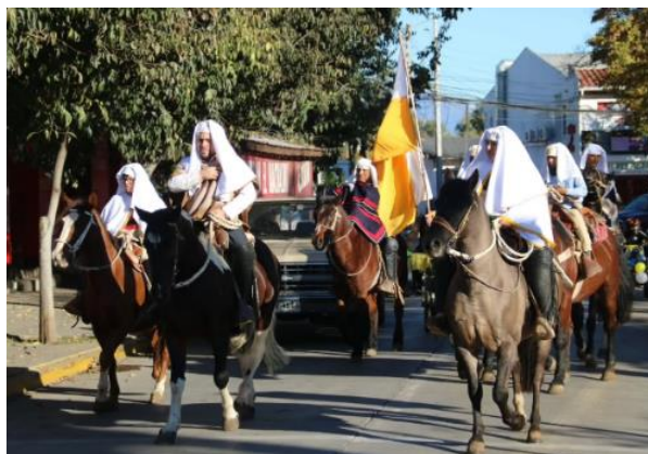
Fiesta de Cuasimodo

La Fiesta de Cuasimodo es una celebración de la religiosidad popular del Chile Central, surgida en el siglo XIX y celebrada en Semana Santa. Iniciada en 1864 para proteger a los sacerdotes que llevaban la comunión a los enfermos. En Machalí el sacerdote recorre la comuna a bordo de un carruaje adornado con cintas y flores, escoltado por numerosos huasos con sus trajes típicos, portando banderas de Chile y del Vaticano (Servicio Nacional de Turismo, 2012).