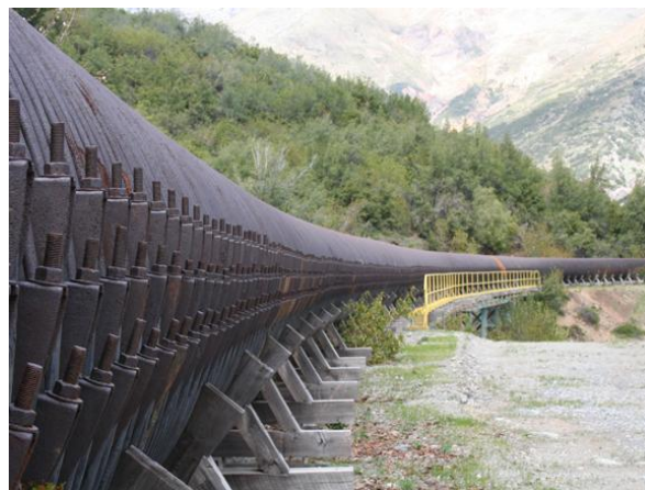
Tubería de Pangal

En el año 2014 bajo Decreto N° 129 fue declarado Monumento Nacional (Consejo de Monumentos Nacionales).