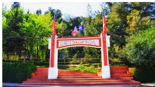
Cerrito San Juan

Es uno de los lugares de cita campestre más tradicionales de la región. Allí se realizan competencias típicas como domaduras, rodeos y amansaduras. En Fiestas Patrias se instalan las fondas y ramadas. Los que concurren a este cerro para disfrutar de un día de picnic, pueden complementarlo con caminatas y cabalgatas. En la laguna del cerro también pueden recrearse paseando en bote. Toda esta zona municipal está dotada de agua potable y servicios higiénicos, mesas de picnic y asaderas (Servicio Nacional de Turismo, 2012).